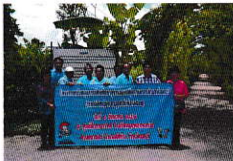
โครงการทัศนศึกษารูงานของกลุ่มเกษตรกร ณ ศูนย์วิทยการใหม่ อ.ฉลิม

7. ส่งเสริมและสนับสนุนการประกอบอาชีพของประชาชน โดยปีนี้ได้มีการจัดโครงการส่งเสริมและพัฒนาอาชีพเกษตรกรเฉพาะด้าน หลักสูตร “การเพาะเมล็ดทานตะวันในภาชนะ” ซึ่งได้รับความร่วมมือจากสำนักงานเกษตรอำเภอเมืองชลบุรี จังหวัดชลบุรี และประชาชนสามารถนำความรู้ที่ได้จากการฝึกอบรมมาประกอบอาชีพเสริมเพิ่มรายได้ให้กับตัวเองและครอบครัวได้