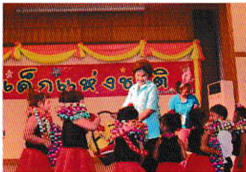
กิจกรรมวันเด็กแห่งชาติ

2. ส่งเสริมให้ประชาชนมีสุขภาพดีถ้วนหน้า โดยจัดอบรมให้ความรู้แก่อาสาสมัคร สาธารณสุขประจำหมู่บ้าน เพื่อให้เกิดความรู้ ความเข้าใจในการดูแล รักษาสุขภาพให้ห่างไกลโรค และสามารถเผยแพร่ให้ความรู้แก่ประชาชนใน ชุมชน ให้เกิดการปฏิบัติได้อย่างแท้จริง ดำเนินการ ควบคุม ป้องกันโรคไม่ให้เกิดการแพร่ระบาด ส่งเสริมการ ออกกำลังกายเพื่อสุขภาพในทุกช่วงวัย นอกจากนี้ยังได้ดำเนินการควบคุมความปลอดภัย จากผลิตภัณฑ์อาหารเพื่อ ให้เกิดความปลอดภัยแก่ผู้บริโภค เผยแพร่ข้อมูลข่าวสารด้านสาธารณสุขเพื่อให้ประชาชนเกิดความตระหนักให้ ความสำคัญต่อการดูแล รักษาสุขภาพอนามัยของตน และคนในครอบครัว