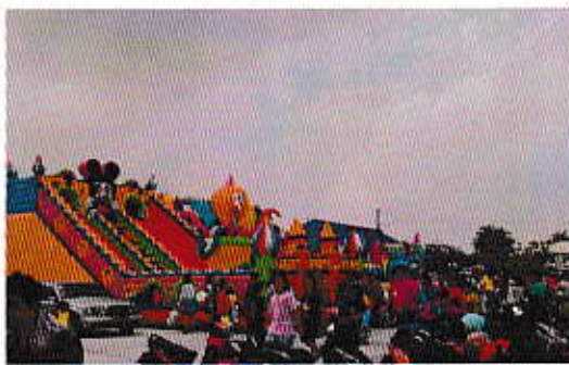
กิจกรรมนัดรักแห่งชาติ

และผลการดำเนินงานในช่วงปีงบประมาณ 2557 มีการดำเนินงานตามนโยบายทั้ง 4 ด้าน ทั้งสิ้น 95 โครงการ เป็นเงินงบประมาณ 38,852,176.-บาท โดยมีการดำเนินโครงการในด้านการพัฒนาด้านสังคมและคุณภาพชีวิต มากที่สุด จำนวน 58 โครงการ ใช้งบประมาณไปทั้งสิ้น 6,226,687.- บาท รองลงมาเป็นการพัฒนาด้านโครงสร้างพื้นฐาน จำนวน 18 โครงการ ใช้งบประมาณไปทั้งสิ้น 21,375,493.- บาท ด้านการบริหารจัดการ จำนวน 16 โครงการ ใช้งบประมาณไปทั้งสิ้น 11,154,596.- บาท และด้านการพัฒนาด้านทรัพยากรธรรมชาติและสิ่งแวดล้อม จำนวน 3 โครงการ ใช้งบประมาณไปทั้งสิ้น 95,400.- บาท สำระสำคัญ ดังนี้