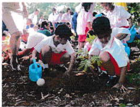
รณรงค์ให้เด็กและชาวเขาปลูกต้นไม้ ฟื้นฟูทรัพยากรธรรมชาติและสิ่งแวดล้อม