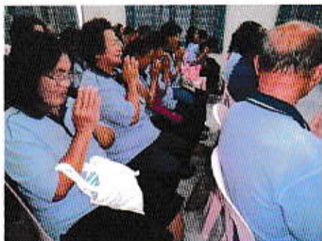
กิจกรรมประชุมประจำเดือนชมรมผู้สูงอายุ

3. พัฒนาคุณภาพชีวิตกลุ่มผู้สูงอายุ และผู้ด้อยโอกาส โดยดำเนินโครงการพัฒนา ศักยภาพผู้สูงอายุ และสำรวจปรับปรุงข้อมูล ผู้พิการ ผู้ป่วยเอดส์ และผู้สูงอายุให้เป็นปัจจุบัน เพื่อขยายบริการเบียดังชีพอ่างทั่วถึงและมีโครงการออกเยี่ยมบ้านผู้สูงอายุ ผู้พิการ ผู้ป่วยเอดส์และผู้ด้อยโอกาส