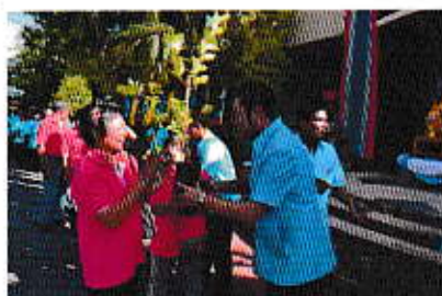
กิจกรรมวันแม่แห่งชาติ