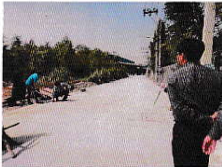
ออกดาวรถกรอกรังถนนภายในตำบล