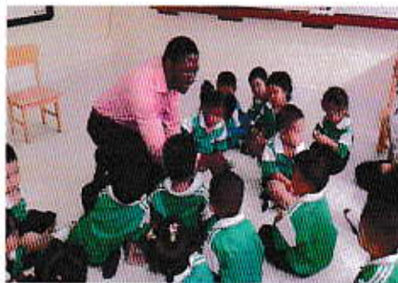
กิจกรรมเสริมความพร้อมคู่สมรส

จากผลการสำรวจความพึงพอใจต่อผลการดำเนินงานของเทศบาล ประจำปีงบประมาณ 2557 พบว่าประชาชนส่วนใหญ่มีคะแนนความพึงพอใจรวมในระดับมากถึงมากที่สุดร้อยละ 70 ซึ่ง อาจกล่าวได้ว่าเทศบาลมีศักยภาพในการพัฒนาท้องถิ่นให้มีความเจริญ และตอบสนองต่อความต้องการของประชาชนได้บรรลุเป้าหมายที่กำหนดในระดับดี (รายละเอียดตามตารางที่ 1)