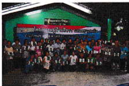
โครงการหมู่บ้านสีขาว ปออลอชเขตจัด ม.6