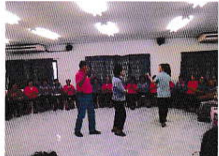
กิจกรรมประชุมประจำเดือนของชมรมผู้สูงอายุ