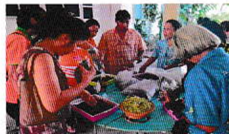
กิจกรรมเพาะเมล็ดทานตะวันในภาชนะ