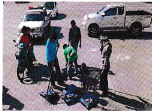
ซ่อมแซมถนนที่ชำรุด เป็นหลุม เป็นบ่อภายในตำบล