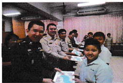
โครงการเยาวชนรุ่นใหม่ ร่วมใจต้านภัยยาเสพติด