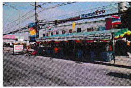
โครงการตั้งจุดบริการประชาชนร่วมเทศกาลปีใหม่

7. ส่งเสริมและสนับสนุนการประกอบอาชีพของประชาชน โดยปีนี้ได้มีการจัดโครงการส่งเสริมและพัฒนาอาชีพเกษตรกรเฉพาะด้าน หลักสูตร “การเพาะเมล็ดทานตะวันในภาชนะ” ซึ่งได้รับความร่วมมือจากสำนักงานเกษตรอำเภอเมืองชลบุรี จังหวัดชลบุรี และประชาชนสามารถนำความรู้ที่ได้จากการฝึกอบรมมาประกอบอาชีพเสริมเพิ่มรายได้ให้กับตัวเองและครอบครัวได้