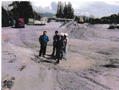
ตรวจโรงเรียนหินคาเชินตำบล