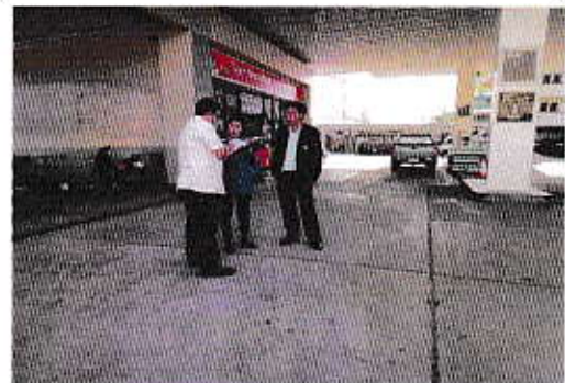
ตรวจสถานีบริการน้ำมันและสถานีบริการรถแท็กซี่ภายในตำบล