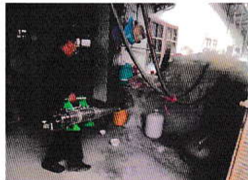
กิจกรรมรณรงค์ออกวัน ก้าวสุขภาพ