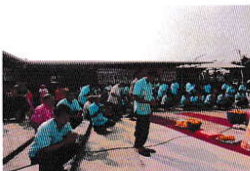
ประเพณีกองข้าวเทวดาเจ้าพ่อแขก ม.6

4. ฟื้นฟู อนุรักษ์ และส่งเสริมศิลปะ วัฒนธรรม ขนบธรรมเนียมประเพณี และภูมิปัญญา ท้องถิ่น ให้คงอยู่อย่างยั่งยืนภายใต้กระบวนการมีส่วนร่วมจากทุกภาคส่วน และเอื้อต่อการพัฒนา เศรษฐกิจของท้องถิ่นให้มีความเข้มแข็ง โดยจัดให้มีกิจกรรมตามประเพณีท้องถิ่นที่มีความเป็น เอกลักษณ์ สวยงาม และหลากหลาย อาทิงานประเพณี กองข้าว งานศาลเจ้าพ่อแขก งานประเพณีรดน้ำขอพรผู้สูงอายุ งานแห่เทียนพรรษา งานสงกรานต์ ตลอดจนสนับสนุนงบประมาณแก่งานหน่วยงานที่เกี่ยวข้องในการดำเนินกิจกรรมต่างๆ