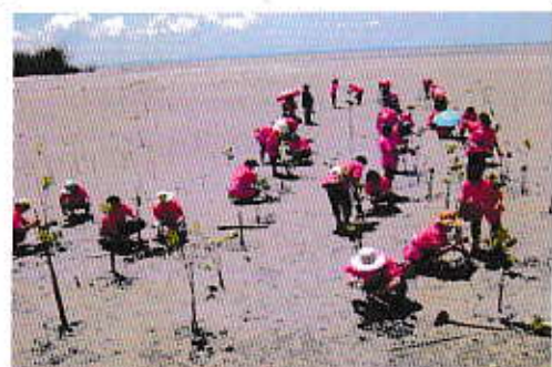
โครงการปลูกต้นไม้ถวายคุณย่าคุณยาย ที่จังหวัดระยอง