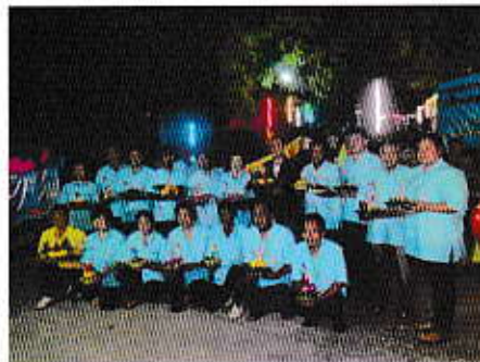
กิจกรรมกองกระทงสไลเดอร์ ณ วัดเขาดิน ม.8

5. การแก้ไขและป้องกันปัญหายาเสพติดในชุมชน การต่อต้านยาเสพติดให้เยาวชน มีภูมิคุ้มกันห่างไกลยาเสพติด ตลอดจนสนับสนุนงบประมาณแก่งานหน่วยงานที่เกี่ยวข้องในการแก้ไขปัญหายาเสพติด ทั้งในระดับอำเภอ และจังหวัด