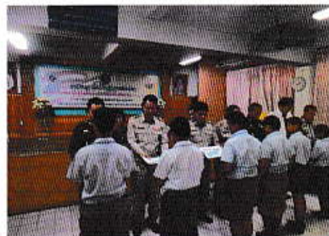
โครงการเยาวชนรุ่นใหม่ร่วมใจกันถักบาตรถวาย