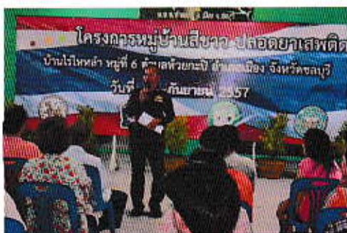
โครงการหมู่บ้านสีขาว ปลอดภัยยาเสพติด ม.6

5. การแก้ไขและป้องกันปัญหายาเสพติดในชุมชน การต่อต้านยาเสพติดให้เยาวชน มีภูมิคุ้มกันห่างไกลยาเสพติด ตลอดจนสนับสนุนงบประมาณแก่งานหน่วยงานที่เกี่ยวข้องในการแก้ไขปัญหายาเสพติด ทั้งในระดับอำเภอ และจังหวัด