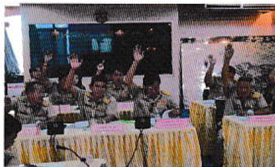
การประชุมสภาเทศบาลตำบลห้วยกะปิ

6. ส่งเสริมและสนับสนุนให้ประชาชนมีส่วนร่วมในการพัฒนาท้องถิ่น โดยสร้างโอกาสให้ ประชาชน เข้ามามีส่วนร่วมในกระบวนการพัฒนาทุกขั้นตอน ตั้งแต่กระบวนการคิด ตรวจสอบและ ติดตามประเมินผล โดยจัดเวที ประชาคม และ โครงการอบรมเพื่อจัดทำแผนชุมชน เพื่อเป็นเวทีรับฟังความคิดเห็น และ ข้อเสนอแนะในการพัฒนา ท้องถิ่นให้ สอดคล้องกับความต้องการของ ประชาชนได้อย่างแท้จริง แต่งตั้งผู้แทน ชุมชนร่วมเป็นคณะกรรมการต่าง ๆ ของ เทศบาล เช่น คณะกรรมการพัฒนา แผนพัฒนาเทศบาล คณะกรรมการสนับสนุนการจัดทำแผนพัฒนาเทศบาล คณะกรรมการจัดซื้อจัดจ้างและตรวจรับพัสดุ คณะกรรมการ ติดตามและประเมินผลแผนพัฒนา เป็นต้น