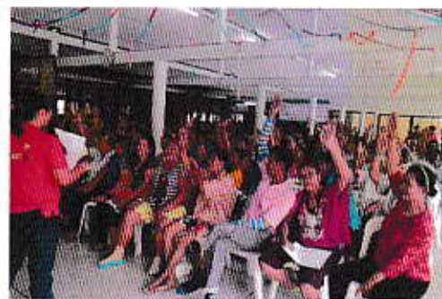
ส่งเสริมให้ประชาชนมีส่วนร่วมในการแสดงความคิดเห็น