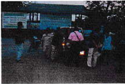
โครงการตั้งจุดตรวจภายในชุมชนร่วมกับเจ้าหน้าที่ตำรวจ

6. เสริมสร้างความมั่นคง และความปลอดภัยในชีวิตและทรัพย์สิน โดยการจัดตั้งสายตรวจตำบล(อปพร.) ร่วมกับเจ้าหน้าที่ตำรวจ จัดเจ้าหน้าที่ร่วมออกตรวจ จัดทำโครงการตั้งจุดบริการประชาชนป้องกันอุบัติเหตุทางถนนในเทศกาลวันปีใหม่ วันสงกรานต์ โดยมีผู้นำชุมชนและเจ้าหน้าที่เตรียมพร้อมตลอด 24 ชั่วโมง