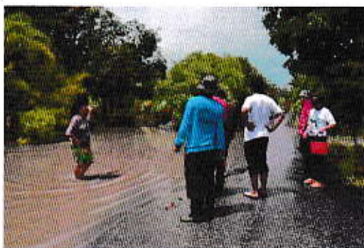
ตรวจพื้นที่น้ำท่วมภายในตำบล