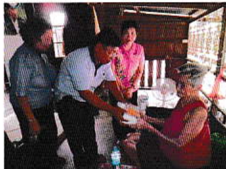
กิจกรรมผู้สูงอายุเยี่ยมผู้ด้อยอายุ

4. ฟื้นฟู อนุรักษ์ และส่งเสริมศิลปะ วัฒนธรรม ขนบธรรมเนียมประเพณี และภูมิปัญญา ท้องถิ่น ให้คงอยู่อย่างยั่งยืนภายใต้กระบวนการมีส่วนร่วมจากทุกภาคส่วน และเอื้อต่อการพัฒนา เศรษฐกิจของท้องถิ่นให้มีความเข้มแข็ง โดยจัดให้มีกิจกรรมตามประเพณีท้องถิ่นที่มีความเป็น เอกลักษณ์ สวยงาม และหลากหลาย อาทิงานประเพณี กองข้าว งานศาลเจ้าพ่อแขก งานประเพณีรดน้ำขอพรผู้สูงอายุ งานแห่เทียนพรรษา งานสงกรานต์ ตลอดจนสนับสนุนงบประมาณแก่งานหน่วยงานที่เกี่ยวข้องในการดำเนินกิจกรรมต่างๆ