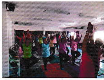
กิจกรรมฝึกโยคะเพื่อสุขภาพ

2. ส่งเสริมให้ประชาชนมีสุขภาพดีถ้วนหน้า โดยจัดอบรมให้ความรู้แก่อาสาสมัคร สาธารณสุขประจำหมู่บ้าน เพื่อให้เกิดความรู้ ความเข้าใจในการดูแล รักษาสุขภาพให้ห่างไกลโรค และสามารถเผยแพร่ให้ความรู้แก่ประชาชนใน ชุมชน ให้เกิดการปฏิบัติได้อย่างแท้จริง ดำเนินการ ควบคุม ป้องกันโรคไม่ให้เกิดการแพร่ระบาด ส่งเสริมการ ออกกำลังกายเพื่อสุขภาพในทุกช่วงวัย นอกจากนี้ยังได้ดำเนินการควบคุมความปลอดภัย จากผลิตภัณฑ์อาหารเพื่อ ให้เกิดความปลอดภัยแก่ผู้บริโภค เผยแพร่ข้อมูลข่าวสารด้านสาธารณสุขเพื่อให้ประชาชนเกิดความตระหนักให้ ความสำคัญต่อการดูแล รักษาสุขภาพอนามัยของตน และคนในครอบครัว