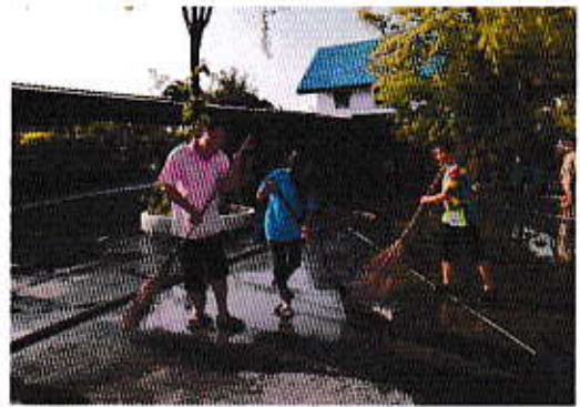
กิจกรรม 5 ส.