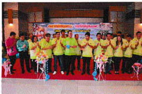
โครงการตลาดนัดชุมชน คนรักสุขภาพ