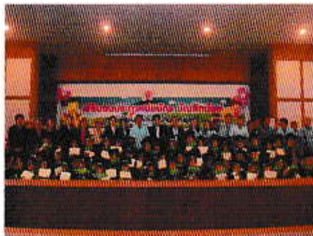
โครงการบัณฑิตน้อย

1. พัฒนาการศึกษามีคุณภาพ โดย พัฒนาหลักสูตร กระบวนการเรียนรู้ และ บุคลากรด้านการศึกษารวมทั้ง ปัจจัยเกื้อหนุนให้ เอื้อต่อการพัฒนาการศึกษาให้มีคุณภาพ สนองความต้องการของผู้เรียน ชุมชน และท้องถิ่น โดยยึด ผู้เรียนเป็นสำคัญ ส่งเสริมทักษะและความสามารถแก่ผู้เรียนตามความสนใจ และพัฒนาสู่ความเป็นเลิศ ทั้งทางด้าน วิชาการ ศิลปะ การแสดง การกีฬาฯ และเน้นให้นักเรียนในเขตความรับผิดชอบของเทศบาล มีความสามารถ และ ทักษะด้านต่างๆ รวมทั้งจัดหาวัสดุครุภัณฑ์เพื่อสนับสนุนการเรียนการสอน พัฒนาความพร้อมแก่เด็กเล็กในศูนย์พัฒนา เด็กเล็ก ให้มีการพัฒนาทั้งด้านร่างกาย จิตใจ อารมณ์ สังคม สติปัญญา อย่างเหมาะสมตามวัย เพื่อให้มีความพร้อมที่ จะเข้ารับการศึกษาในระดับ